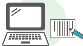
オープンキャンパスでの 学科イベントの感想(web入力)